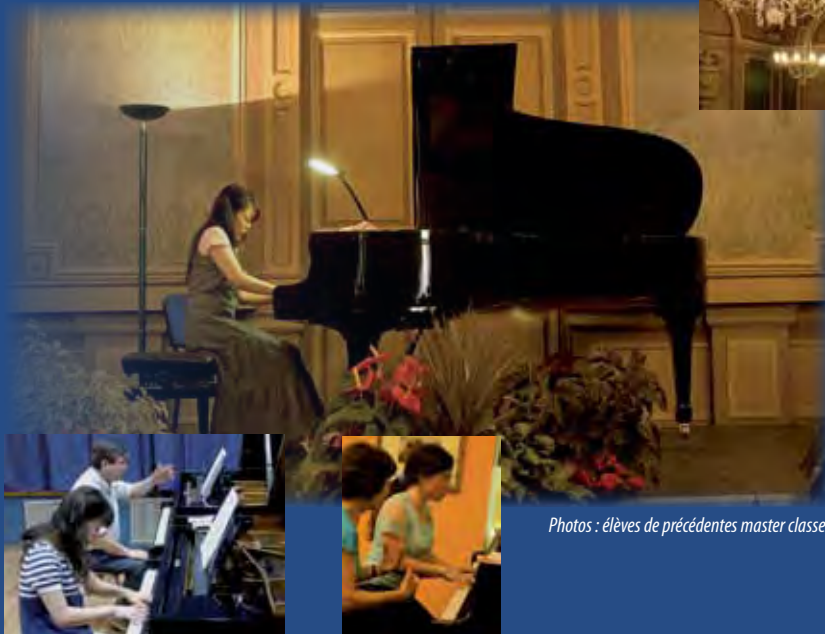
Photos : élèves de précédentes master classes

Comme tous les concerts du Festival, ce concert de clôture donné par les lauréats de la Master Classe, est ouvert à tous et gratuit.